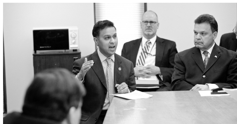
El Comisionado de Salud del Estado de Nueva York, el Dr. Shah, explica las iniciativas establecidas por el Departamento de Salud del Estado de Nueva York.

El nuevo programa Salud en Casa garantizará que los hospitales, centros de ancianos, centros de rehabilitación y médicos de atención primaria se comuniquen con respecto a cada paciente. El propósito de esto es evitar la readmisión del paciente a los hospitales y los síntomas adversos como resultado de la ingestión de medicamentos contradictorios recetados por dos o más médicos. En el