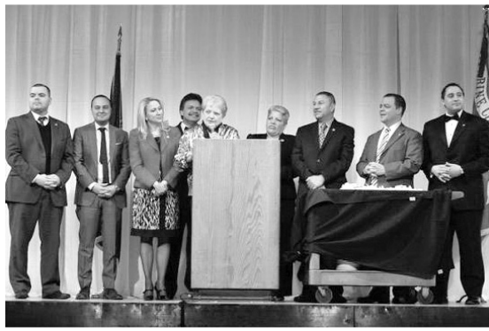
Miembros de la Comisión se dirigen a los participantes de la Conferencia en la gala anual.