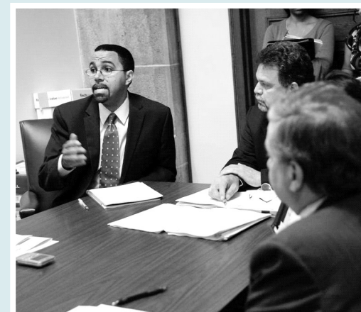
El comisionado John B. King, Jr. habla sobre la desigualdad en el sistema educativo para los estudiantes que están aprendiendo inglés.