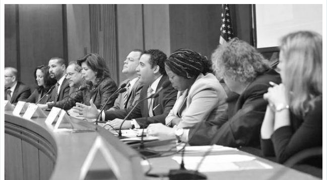
Presentadores discuten nuevas iniciativas para el desarrollo de la fuerza laboral en el taller de Desarrollo Económico.