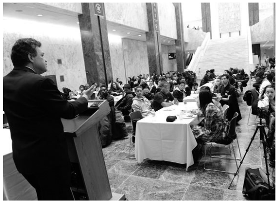
El asambleísta Félix W. Ortiz habla con estudiantes en la Reunión Juvenil de la Comunidad.

El tema de este año en la Conferencia ‘Somos El Futuro’ fue “El Tiempo es Ahora” para empoderar a nuestra juventud, construir poder político, crear coaliciones cívicas, moldear nuestro sistema educativo, abogar por mejores viviendas públicas, ayudar a los veteranos, aumentar la disponibilidad de información en varios idiomas, reformar el sistema migratorio y mucho más.