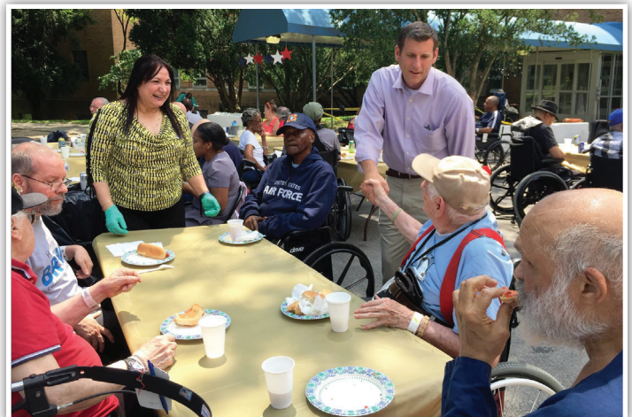
州眾議員布朗斯丹參加了在聖奧本斯紐約州退伍軍人家舉辦的退伍軍人同濟會野餐。