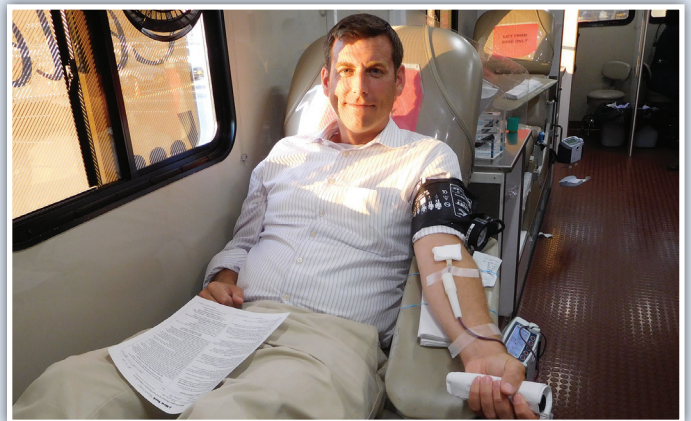
州眾議員布朗斯丹在獻血，他的辦公室與紐約血液中心聯合在海灣台購物中心舉辦第6屆獻血活動。一百多名獻血者參加了這次活動。