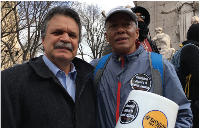
Our children deserve the best. I marched for equality in education aid funding for New York City. Nuestros niños se merecen lo mejor. Marché por la igualdad en el financiamiento para la ayuda de la educación en la ciudad de Nueva York.

La educación de calidad asequible es importante. Los jóvenes de Nueva York tienen oportunidades que dependen de la asequibilidad de la universidad. Reconocemos que para muchos neoyorquinos, la educación avanzada no sería posible sin las grandes inversiones en la educación avanzada. Para asegurar que cada niño tenga acceso a oportunidades académicas y económicas, el estado de Nueva York incluyó en su presupuesto el Programa de Becas Excelsior, el primer programa en el país que hace la matrícula de las universidades públicas del estado de Nueva York gratuita para las familias con ingresos de hasta $125,000 por año. Aproximadamente el 80 por ciento, o 940,000 personas y familias de clase media, calificarían para asistir con matrícula gratuita a todas las universidades de dos y cuatro años de CUNY y SUNY en el estado de Nueva York. El presupuesto provee una cantidad récord para apoyar a la educación avanzada, un total de $7.5 mil millones, un aumento de 6.3 por ciento en comparación al año pasado.