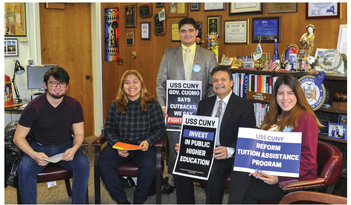
We must strengthen New York's commitment to college access through the Tuition Assistance Program (TAP). Debemos de fortalecer el compromiso de Nueva York para el acceso a la universidad mediante el Programa de Asistencia con la Matrícula Universitaria (TAP, por sus siglas en inglés).